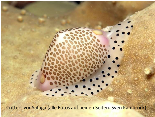
Critters vor Safaga